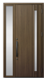
□M 26 型 カラー：クリエモカ