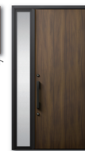
□M 17 型