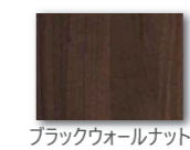
ブラックウォールナット