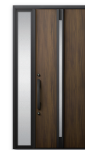
□M 22 型