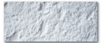
アンティークストーン T1000